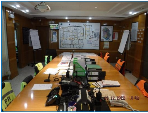
ภาพถ่ายที่ 2.2-25 ศูนย์ปฏิบัติการควบคุมภาวะฉุกเฉิน (ECC)