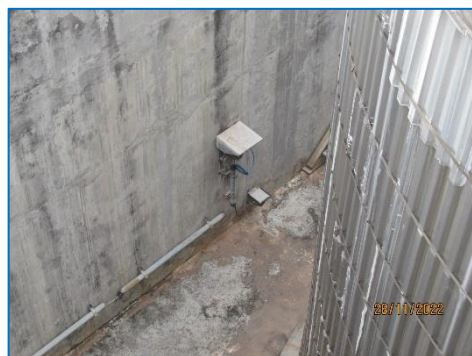
ภาพถ่ายที่ 2.2-23 Gas Detector ที่ถังเก็บ Acetone