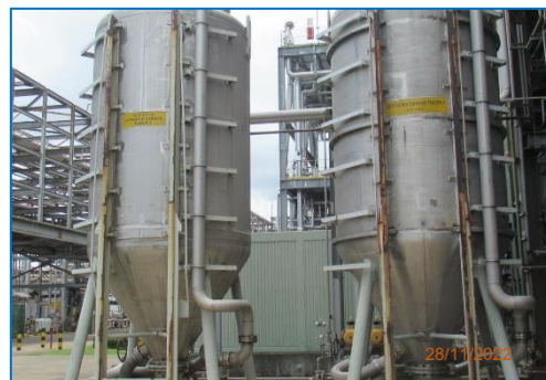
ภาพถ่ายที่ 2.2-6 ระบบดูดซับด้วยถ่านกัมมันต์ ของส่วนผลิต BPA