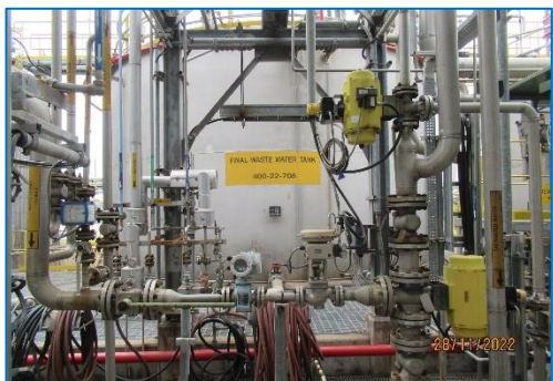
ภาพถ่ายที่ 2.2-5 Final Wastewater Tank