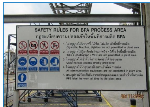
ภาพถ่ายที่ 2.2-24 กฎระเบียบความปลอดภัยในพื้นที่การผลิต