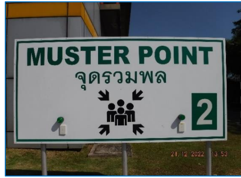
ภาพถ่ายที่ 2.2-26 จุดรวมพลของโครงการ