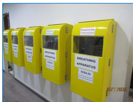
ภาพถ่ายที่ 2.2-22 หน้ากากชนิดถังติดตัวบุคคล (SCBA)