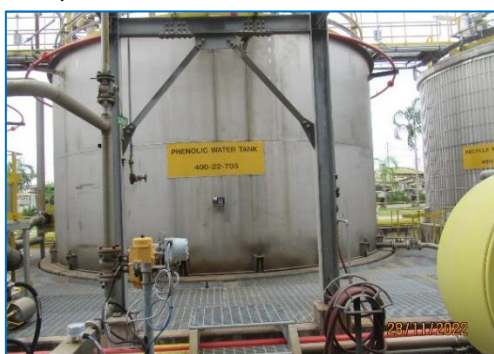
ภาพถ่ายที่ 2.2-4 Phenolic Water Tank