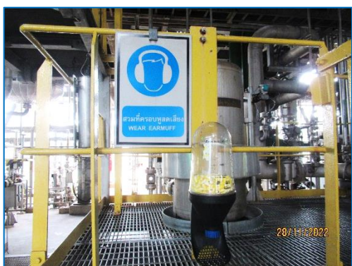
ภาพถ่ายที่ 2.2-1 ป้ายเตือนให้สวมใส่อุปกรณ์ป้องกันเสียงดัง