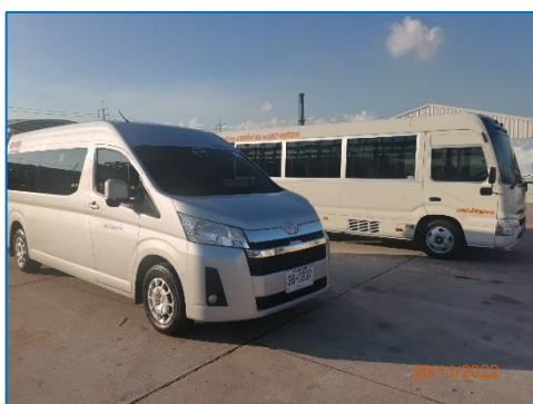
ภาพถ่ายที่ 2.2-19 รถรับส่งพนักงานบริษัท