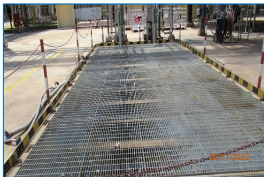
ภาพถ่ายที่ 2.2-11 Process Wastewater Sump