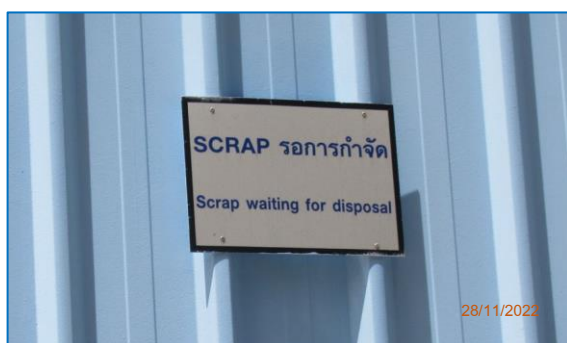
ภาพถ่ายที่ 2.2-15 Scrap Area