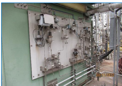
ภาพถ่ายที่ 2.2-3 อุปกรณ์ TOC Online