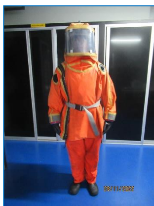
ภาพถ่ายที่ 2.2-21 ชุดป้องกันสารเคมี