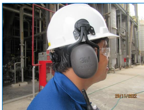
ภาพถ่ายที่ 2.2-2 อุปกรณ์ป้องกันอันตรายส่วนบุคคล (PPE) สำหรับพนักงานที่สัมผัสกับเสียงดัง