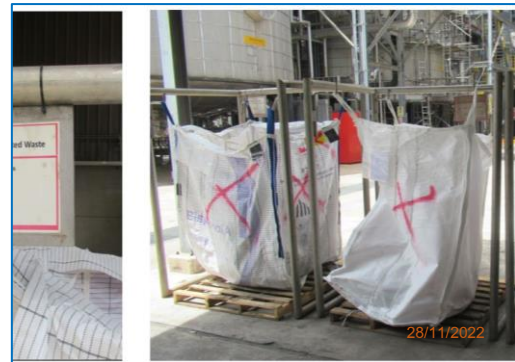
ภาพถ่ายที่ 2.2-14 ภาพขณะบรรจุ บริเวณลานเก็บของเสีย