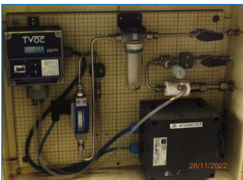
ภาพถ่ายที่ 2.2-7 Phenolic Online Analyzer