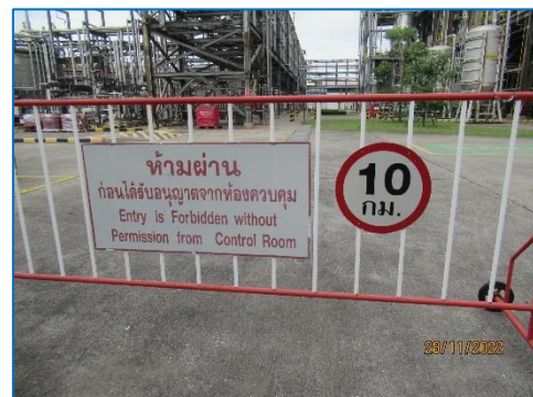
ภาพถ่ายที่ 2.2-16 ป้ายเครื่องหมายจราจรในพื้นที่โครงการ