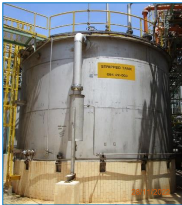
ภาพถ่ายที่ 2.2-9 Stripped Wastewater Tank