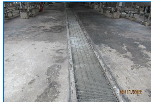
ภาพถ่ายที่ 2.2-12 รางระบายน้ำภายในพื้นที่โครงการ