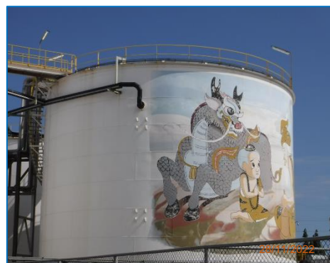
ภาพถ่ายที่ 2.2-8 Hold Tank สำหรับกักเก็บน้ำเสีย