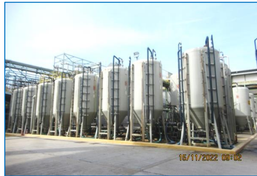
ภาพถ่ายที่ 2.2-10 Activated Carbon Adsorber ของส่วนผลิต PC