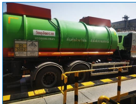
ภาพถ่ายที่ 2.2-18 รถขนส่งวัตถุดิบและสารเคมี