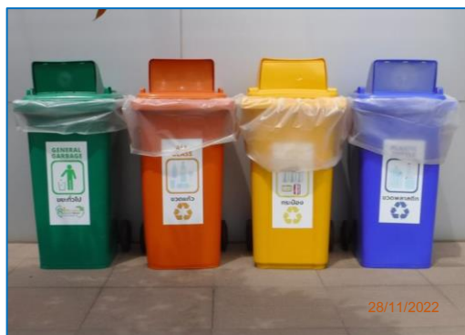
ภาพถ่ายที่ 2.2-13 ถังขยะแยกประเภท